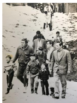
羽黒山にて ジャケットが父、手を繋いでいるのが弟、左下が私、兄は輪島関の後。 弟と輪島関の間にいるのは赤の他人。